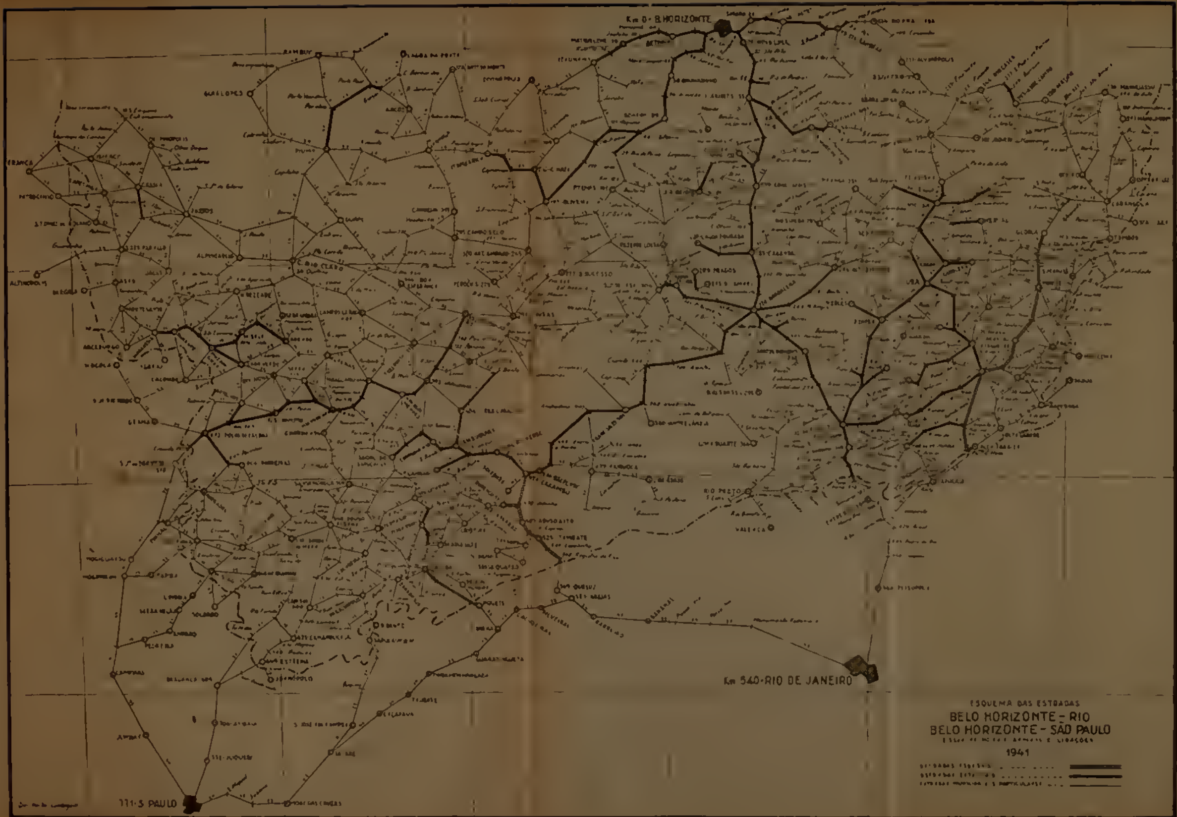
ESQUEMA DAS ESTRADAS BELO HORIZONTE - RIO DE JANEIRO BELO HORIZONTE - SÃO PAULO