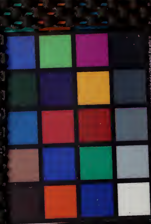
Image provided by Munsell Color Services Lab, Inc. (Munsell Color Services Lab, Inc. is a registered trademark of Munsell Color Services Lab, Inc.)