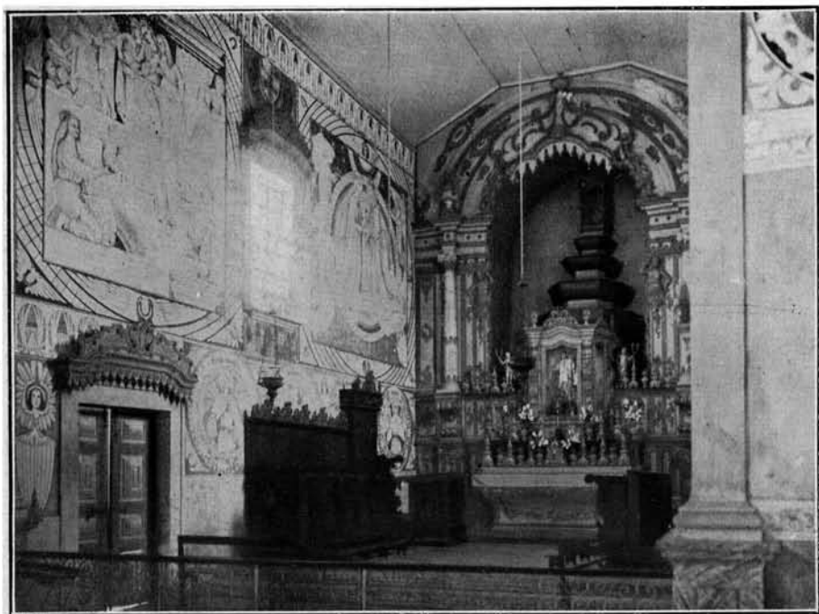
Interior do Convento de São Bento — Olinda — Estado de Pernambuco