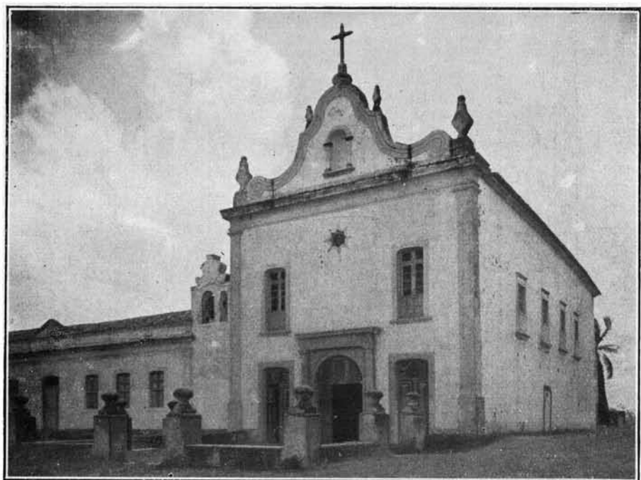
Fachada da Igreja do Monte — Olinda — Estado de Pernambuco