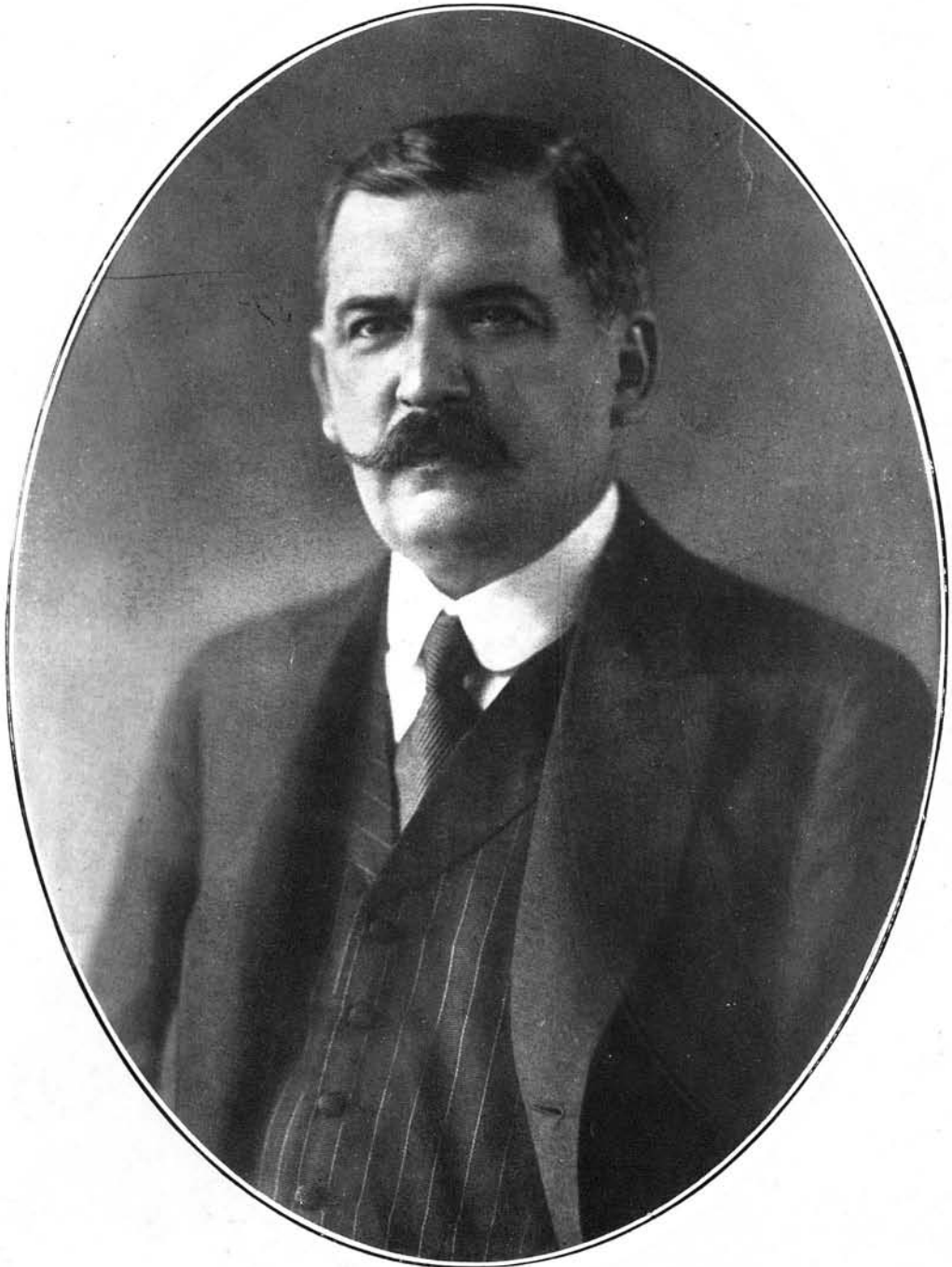
Dr. Wenceslau Braz Pereira Gomes

Ex-Presidente da Republica. Iniciador da estatística official no Estado de Minas