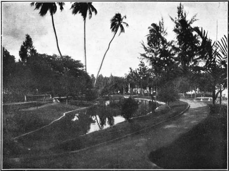
Praça Sergio Loreto — Recife — Estado de Pernambuco