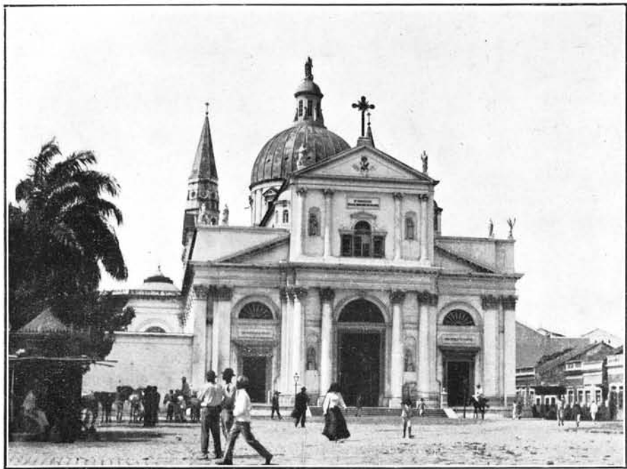
Igreja da Penha — Recife — Estado de Pernambuco