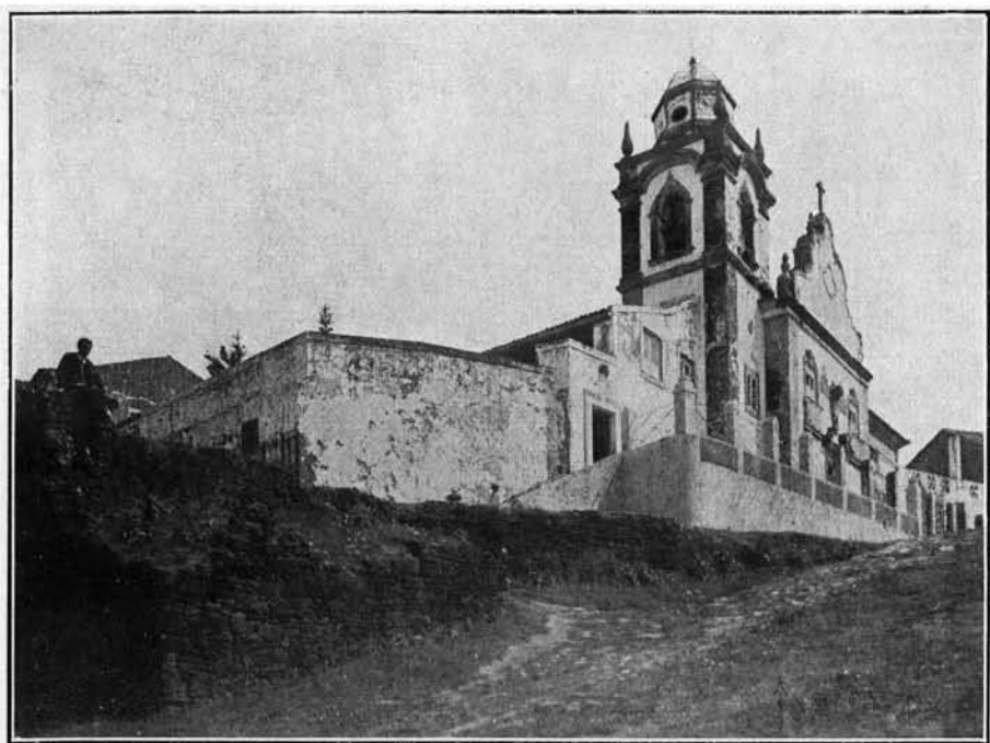
Cathedral de Olinda — Estado de Pernambuco