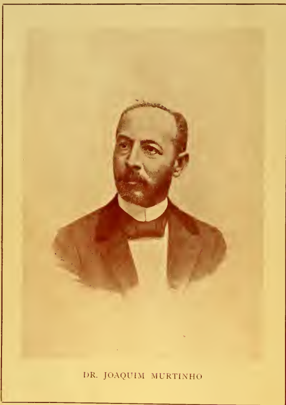
DR. JOAQUIM MURTINHO